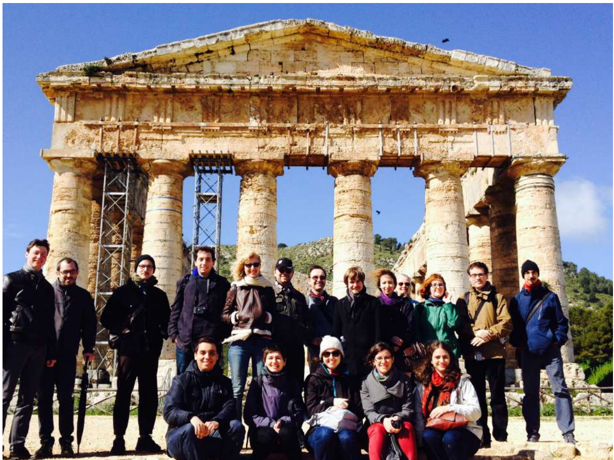
Le groupe des Argonautes à Ségeste (Sicile, mars 2016)

Si vous souhaitez adhérer ou être tenu.e au courant des événements organisés, vous pouvez les contacter à l'adresse bureau.argonautes@gmail.com ou leur écrire par courrier au 2, rue Vivienne, Bibliothèque Gernet-Glotz, 75002 Paris.