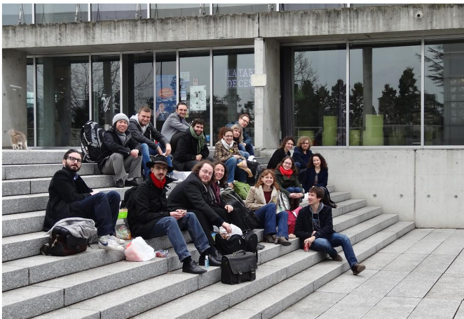
Le groupe des Argonautes devant l'entrée du musée gallo-romain de Saint-Romain-en-Gal à côté de Vienne.