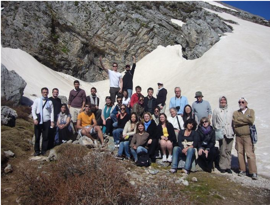
Le groupe des Argonautes devant l'entrée (masquée) de la grotte du Mont Ida, un des lieux de la naissance de Zeus.

Rendez-vous sur le site : http://association.lesargonautes.perso.sfr.fr