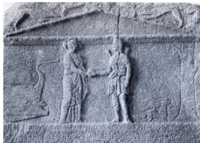
La déesse Diktyнна, à droite, représentant la cité de Polyrhénia sur la stèle du traité entre Polyrhénia et Phalasarna (début du III e s. a.C.), Diktyннаion, Crète (Photo M. Guarducci, IC II, XI, 1, p. 132).

Artémis Diktyнна était une déesse de la Crète occidentale protectrice des navigateurs, dont le nom renvoie aux « filets, rets » ( diktya ), dans lesquels elle avait été sauvée par des pêcheurs. Pendant une dizaine d'années, DIKTYNNA a été un programme de recherche dans notre unité réunissant historiens et épigraphistes soucieux d'explorer l'interconnexion des cités grecques du bassin méditerranéen aux époques hellénistique et impériale.