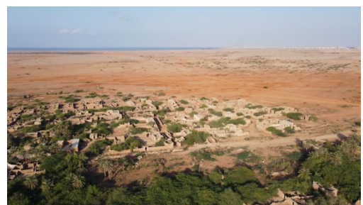
Vue aérienne du site d'al-Qusār

Mon programme de recherche archéologique consiste en une étude de l'appropriation d'un territoire insulaire (l'archipel des îles Farasān) dans le sud de la mer Rouge par un contingent militaire de l'armée romaine au II e siècle de notre ère. En 2004 a été publiée une inscription latine datée de 144 de n.è. qui commémore la construction d'un monument par la Legio II Traiana Fortis et mentionne le toponyme antique de l'archipel Ferresan . Un second texte fragmentaire est publié en 2007, celui-ci, daté de 120 de n.è., mentionne la Legio VI Ferrata .