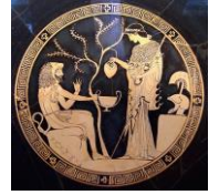
Coupe, Douris, Munich 2648