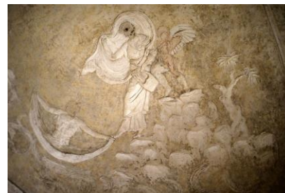
« Le saut de Sappho », Rome, basilique hypogée de la Porta Maggiore, fragment de stuc de la voûte (I er s. de n. è.)

Cette année de délégation est consacrée à la publication et à la première traduction commentée en français des fragments de Publius Nigidius Figulus. Cet auteur est particulièrement mal connu, non seulement à cause de l'état très fragmentaire de son œuvre, mais aussi du fait d'une lacune dans les recherches sur ce personnage pourtant important de la fin de la République – quoiqu'un regain d'intérêt autour de cette redécouverte semble émerger, avec une rencontre organisée en avril 2022 à Columbia, et des interventions sur le pythagorisme tardo-républicain lors de la dernière rencontre, en novembre 2022, des Pseudopythagorica - projet soutenu par le LabEx Hastec.