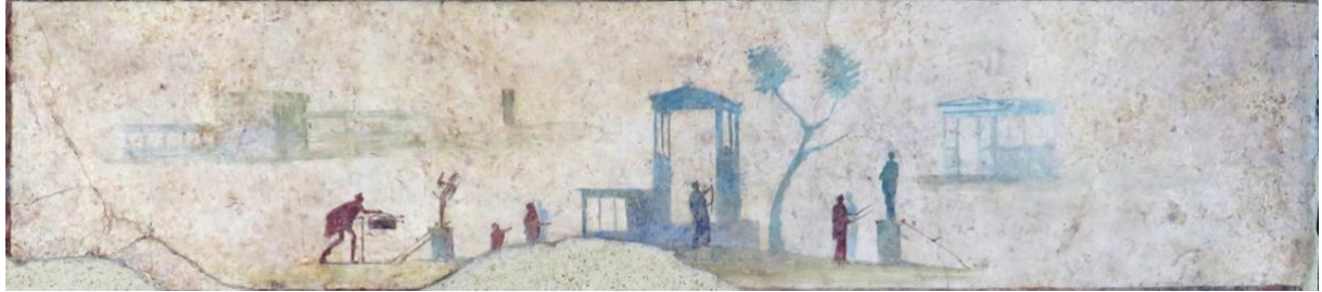
Columbarium de la Villa Doria Pamphili, époque augustéenne - Rome, Museo Nazionale Romano (Palazzo Massimo alle Terme), détail

ou zoom (demander l'adresse à petits.dieux@gmail.com )